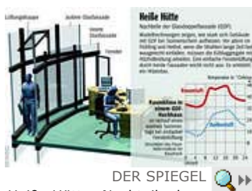
Heiße Hütte: Nachteile der Glasdoppelfassade

Wie viel Strom diese Art von Zwangsklimatisierung frisst, mögen die Betreiber nicht verraten. Bei seiner Recherche stieß Eicke-Hennig auf eine Mauer des Schweigens.